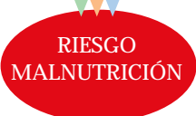
TABLA 9: Nutrition Screening Initiative. Nivel I